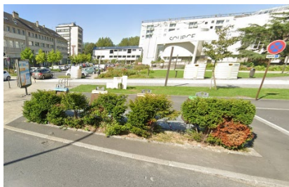
Pl du champ de Mars (remplacement)