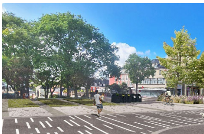
Pl G al De Gaulle