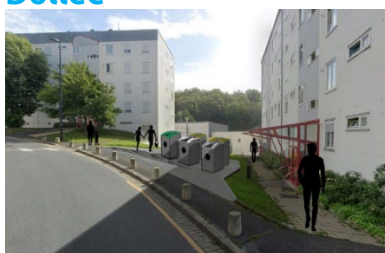
Rue Belle croix