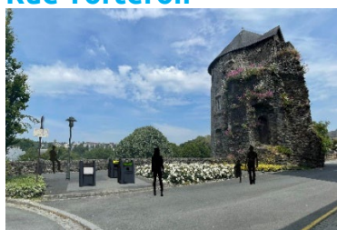
Rue du château